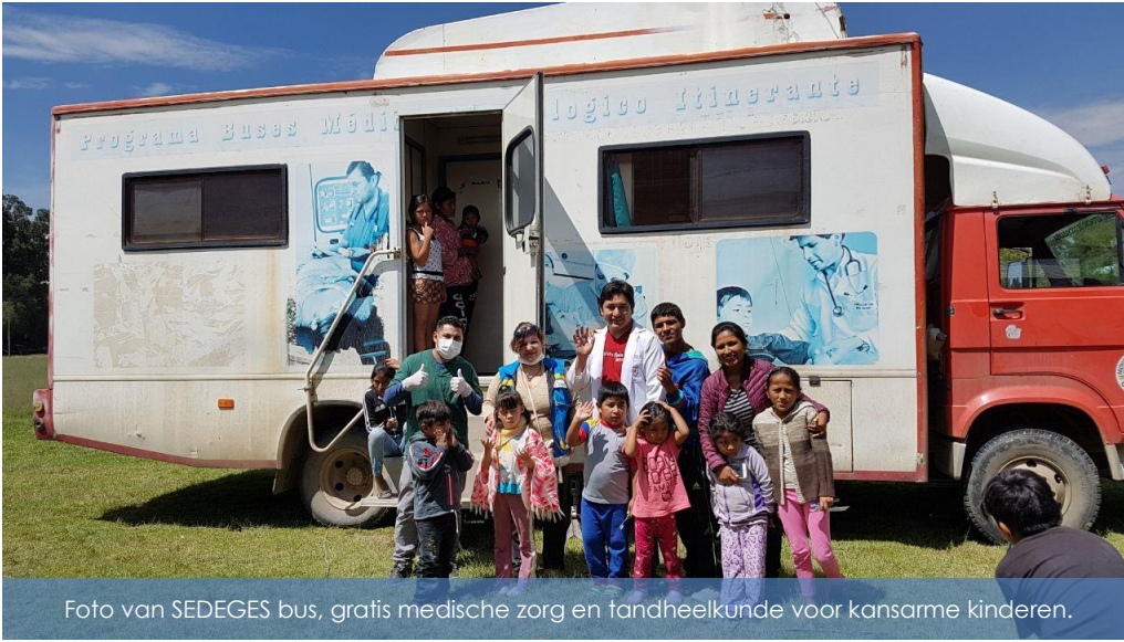
Foto van SEDEGES bus, gratis medische zorg en tandheelkunde voor kansarme kinderen.